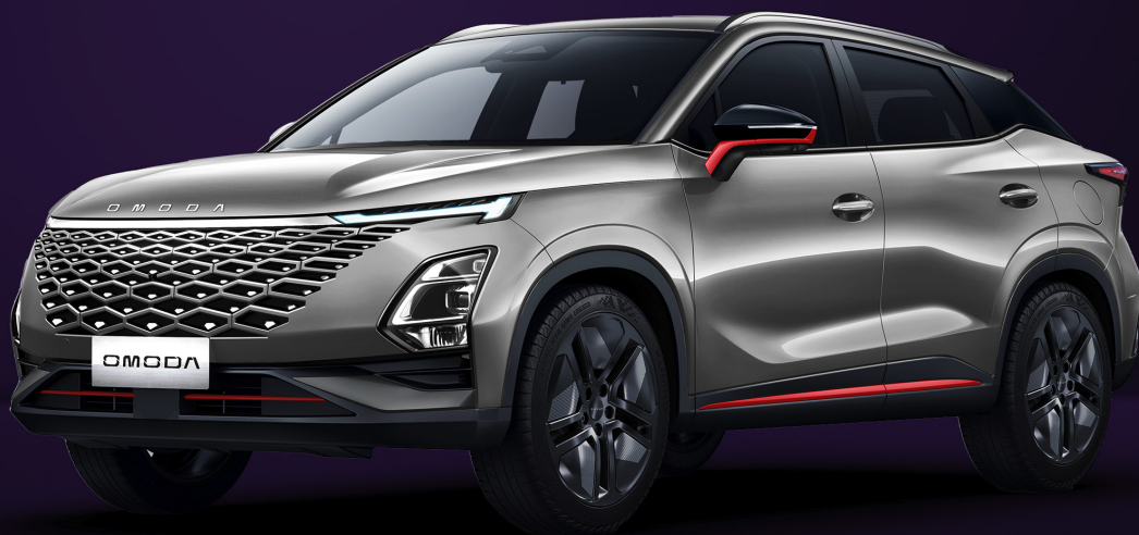
KOVOVĚ STŘÍBRNÁ RED TRIM (KX1)