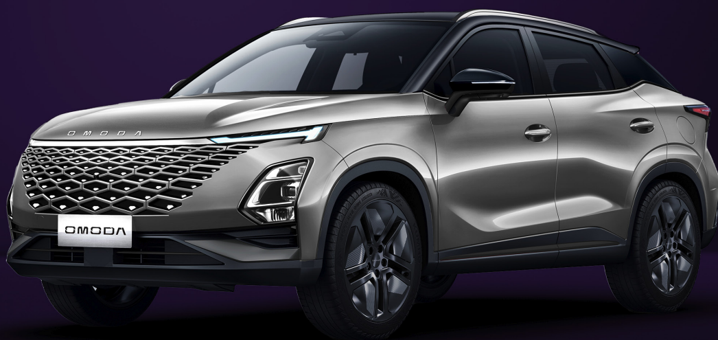
UHLÍKOVĚ ČERNÁ A KOVOVĚ STŘÍBRNÁ (X40)