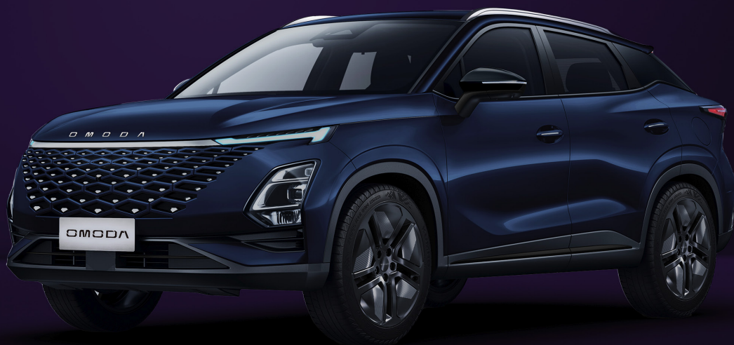
NOČNÍ MODRÁ (WB0)