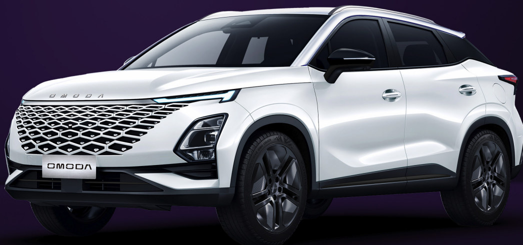
KHAKI BÍLÁ (BW0)