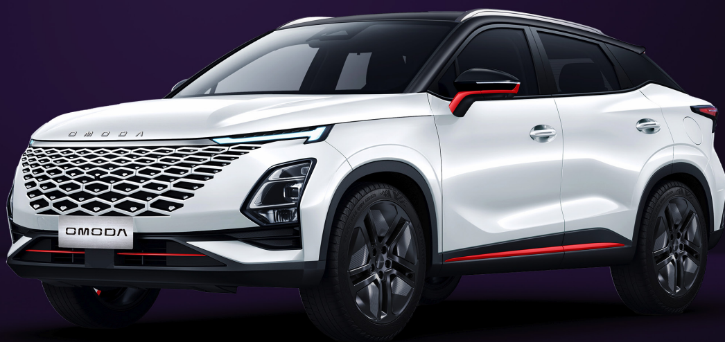
UHLÍKOVĚ ČERNÁ A KHAKI BÍLÁ RED TRIM (ZE1)